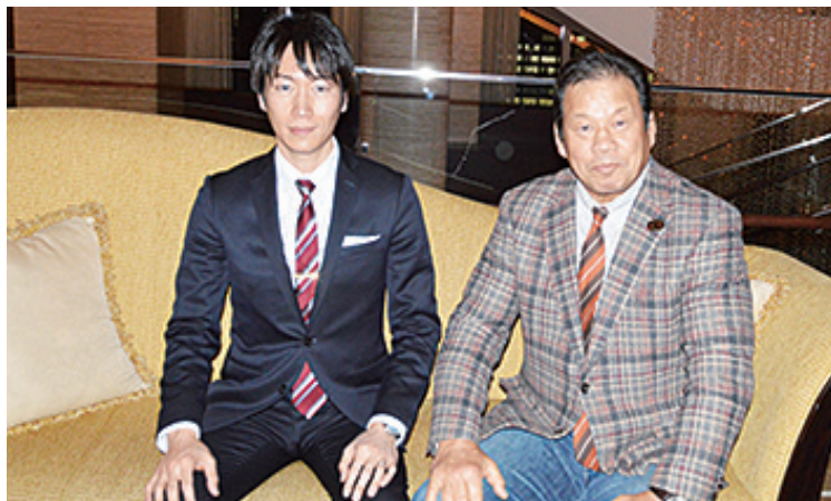
同氏は、顕在意識の『使い方』のコツを押さえる事で、全ての人が知的脳力、及び能力(スポーツ含む)を高める事が出来ると断言する。ボーリングとフルマラソンでは、いずれも一年程度の練習期間で、自己最高スコア279点 (10連続5)、及び、3時間17分 (TOKYO2015)の記録を保持。

同氏はスキルを脳力開発/英語習得/経営コンサルティングの指導に生かし、多くの経営者/医師/建築士受験生達に大きな成果を上げてきた。人生をより輝かせる『アファ式』を日本、いずれば世界に広めるべく日々精力的に活動している。